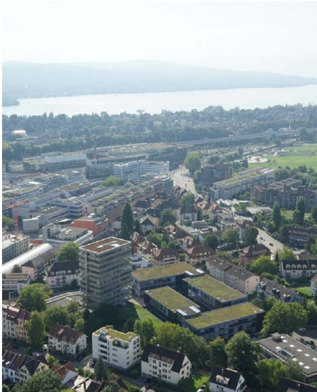
Patio Areal aus der Vogelperspektive