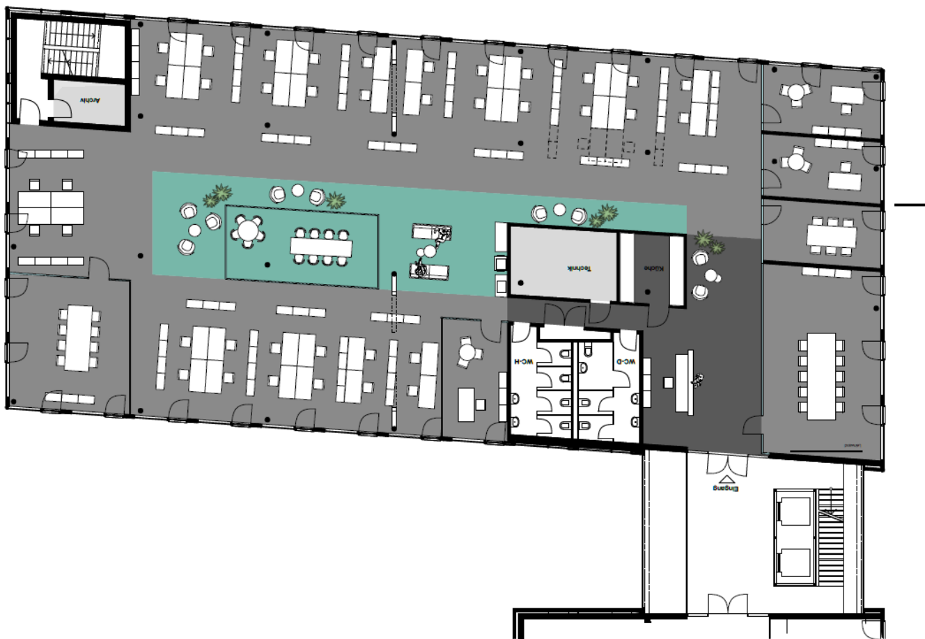
Exemplarische Möblierung, moderner Mieterausbau