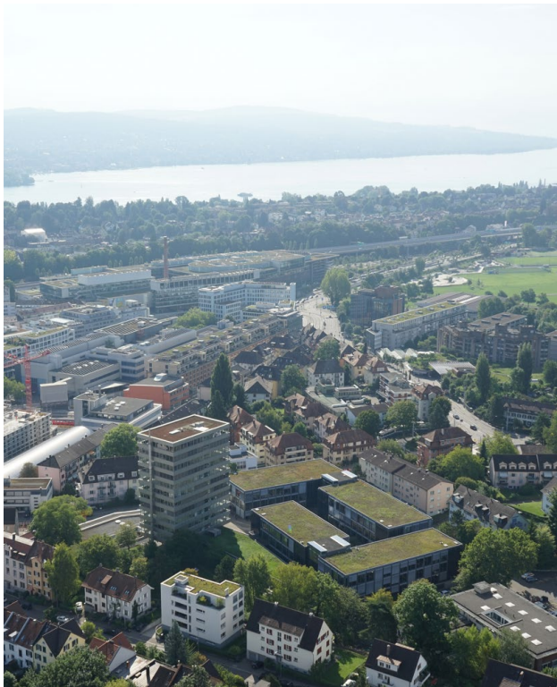
Patio Areal aus der Vogelperspektive